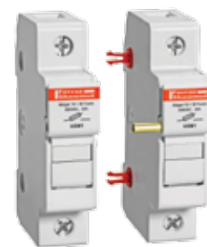
USM1 avec tiges d'attache